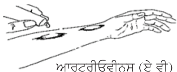
ਆਰਟਰੀਓਵੀਨਸ (ਏ ਵੀ) ਫਿਸਟੂਲਾ

ਵੈਨਕੂਵਰ ਜਨਰਲ ਹਸਪਤਾਲ ਫਾਰਮੋਸੀ ਡਿਪਾਰਟਮੈਂਟ ਵਲੋਂ ਤਿਆਰ ਕੀਤੇ ਗਏ ਪੈਸੈਂਟ ਟੀਚਿੰਗ ਪੈਂਫਲਿਟ ਤੋਂ ਧੰਨਵਾਦ ਸਹਿਤ ਅਪਣਾਇਆ।