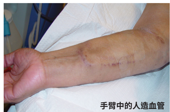
手臂中的人造血管