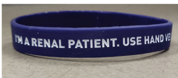
佩戴卑詩腎臟中心的腕帶