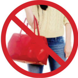
不要使用植有人造血管的手臂肩背沉重的袋子