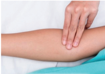
檢查是否有震顫情形