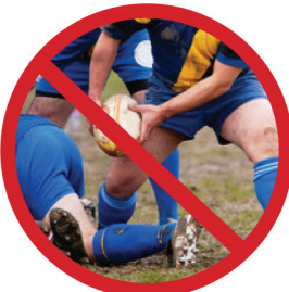
避免身體接觸運動