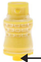
導管接頭蓋的凸面魯爾旋鎖端

魯爾旋鎖(Luer Lock)是連接針筒或導管接頭蓋的一個螺旋裝置，有不漏的密封功能。